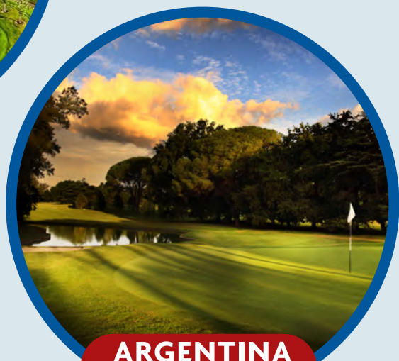
ARGENTINA 1 al 8 Diciembre Puente Inmaculada