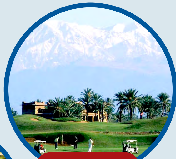
MARRAKECH 1 al 5 Mayo Puente 1 de Mayo