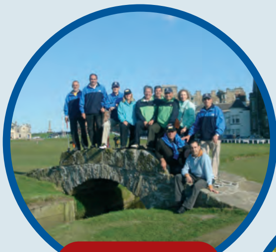
ST. ANDREWS 13 al 17 Abril

acompañando a nuestros clientes y amigos a los mejores destinos de golf del mundo