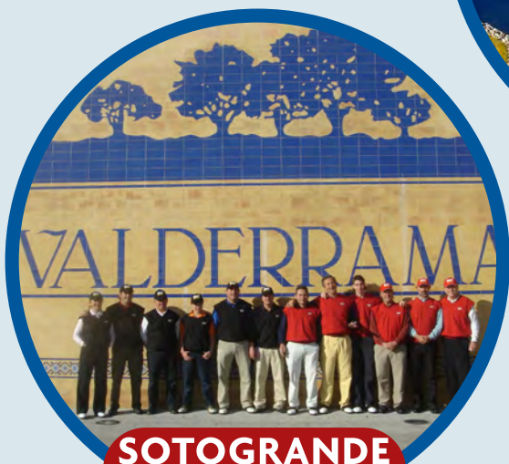
SOTOGRADE 1 al 3 Noviembre Puente Todos Santos