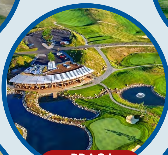
PRAGA 13 al 16 Junio